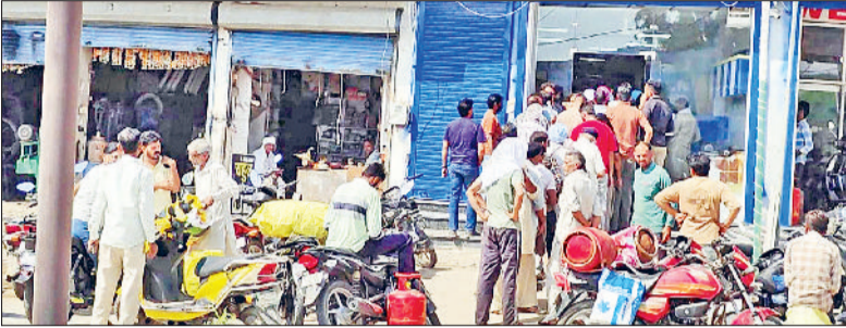
रतिया। गैस एजेंसियों पर लगी लोगों की भीड़ और शहर की सुखमणी भारत गैस एजेंसी का फाइनल फोटो।

इजराइल-अमेरिका और ईरान युद्ध के चलते फतेहाबाद जिले में घरेलू गैस को लेकर लोगों में हाहाकार की स्थिति बनी हुई है। जिले में आईओसीएल की गैस एजेंसी इंडेन के पास स्टॉक खत्म है जबकि बीपीसीएल और एचपीसीएल के पास पर्याप्त स्टॉक है लेकिन लोगों में भविष्य में गैस किल्लत की संभावना को देखते हुए गैस एजेंसी के बाहर लाइन लगी रही है। माना जा रहा है कमर्शियल गैस सिलेंडर पर प्रतिबंध के बावजूद व्यवसायिक संस्थानों ने गैस की 'कृत्रिम शॉर्टेज' की स्थिति पैदा कर दी है। गैस एजेंसियों के संचालकों व जिला प्रशासन का साफ कहना है कि जिले में किसी प्रकार की घरेलू गैस की कमी नहीं है। घरेलू उपभोक्ता 25 दिन अब अपने सिलेंडर की बुकिंग कराएंगे। बुकिंग के दो दिन के अंदर उनको सिलेंडर मिल जाएगा। इसके लिए उपभोक्ता को जरूरी प्रक्रिया अपनानी होगी। उधर, गैस एजेंसियों के टोल फ्री नंबर में तकनीकी खराबी आने के चलते बुधवार को पूरे देश में ऑनलाइन गैस सिलेंडरों की बुकिंग नहीं हो सकी। इन परिस्थितियों ने आम जनता व प्रशासन के लिए 'कोड में खराब' का काम किया है। जब से ईरान-अमेरिका के बीच युद्ध शुरू हुआ है तो वहां से भारत आने वाले कच्चे तेल के आयात को लेकर तरह-तरह की आशंकाएं व्यक्त की जा रही हैं। जंग के 12वें