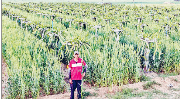
भद्रकलां। ड्रैगन फ्रूट के पौधे के बीच खड़ी गेहूं की फसल।

ड्रैगन फ्रूट के पौधे के बीच खड़ी गेहूं की फसल।