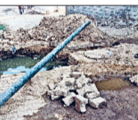
फतेहाबाद। माजरा रोड पर बना खुला पड़ा सीवरेज मेनहोल।