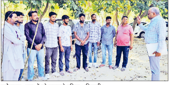
फतेहाबाद। युवाओं को समझाते पुलिस अधिकारी।