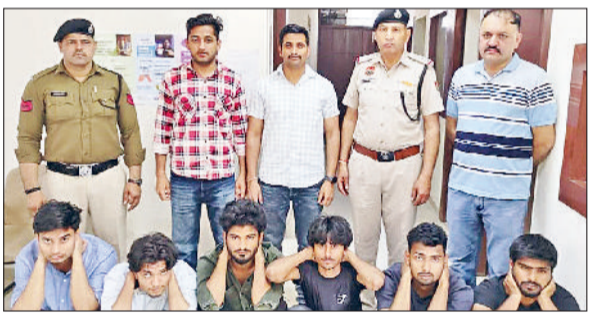
सिरसा। पुलिस द्वारा गिरफ्तार किए गए साइबर टग।