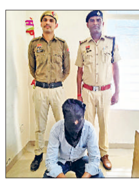
फतेहाबाद। साइबर टगी मामले में गिरफ्तार युवक।

किया था। शिकायतकर्ता ने बताया था कि 9 दिसंबर 2024 को उनके मोबाइल पर एक अनजान लिंक आया था। उस लिंक पर क्लिक होते ही फोन में एक एपिके फाइल डाउनलोड हो गई, जिससे उनके फोन का पूरा एक्सेस साइबर टगों के पास चला गया। इसके बाद टगों ने उनके एचडीएफसी बैंक के क्रेडिट कार्ड से 75 हजार 900 रुपये की अवैध ट्रांजैक्शन कर ली। शिकायत के आधार पर थाना साइबर फतेहाबाद में 22 अप्रैल 2025 को केस दर्ज किया गया था। इस मामले में तकनीकी जांच और बैंक खातों के विश्लेषण के आधार पर तीन आरोपियों को पहले ही गिरफ्तार