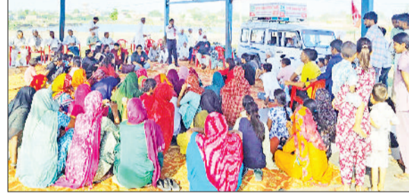
भटूकला। ग्रामीण सभाओं को संबोधित करते माकपा नेता।